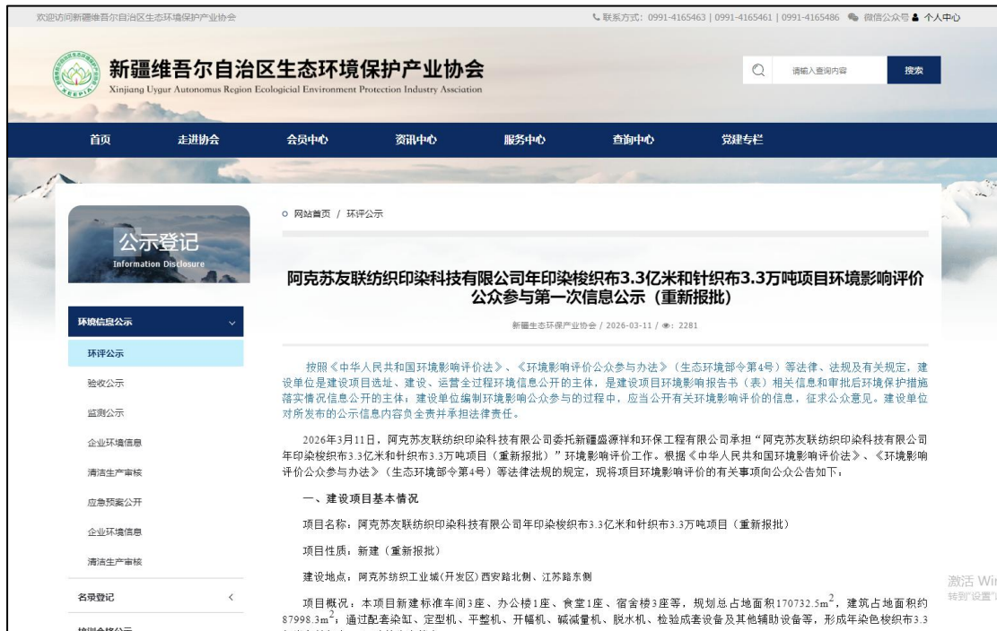
图 1 首次环境影响评价信息网络公示截图